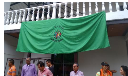
Escuela de formación campesina Raúl Valbuena, ubicada en el municipio de Viotá, Cundinamarca – Colombia.