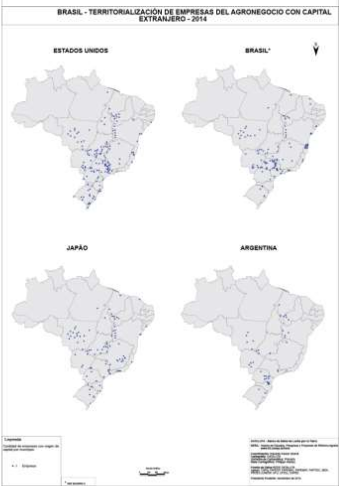
Plancha03: Numero de empresas del agronegocio con capital extranjero.