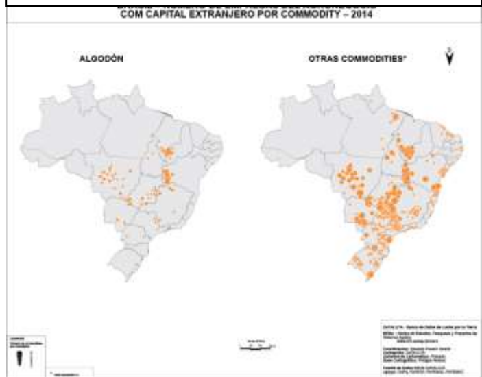
Plancha 02: Numero de empresas del agronegocio con capital extranjero por commodity.